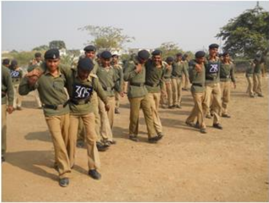
एक पैर को सहारा देकर ले जाना