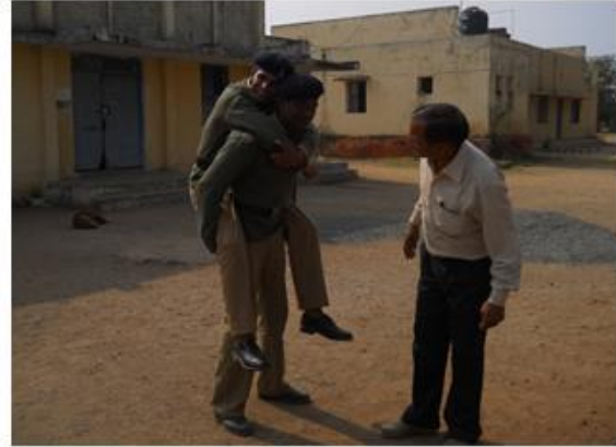
पीठ पर ले जाना