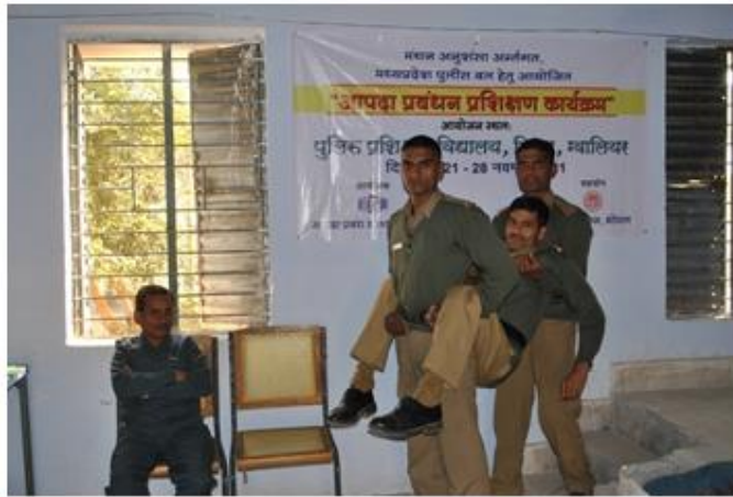
फोर एवं ऑफ्ट विधि