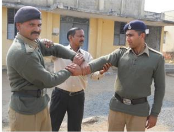
श्री हैण्ड शीट विधि