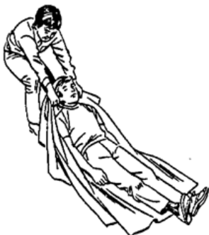
कम्बल अथवा चादर के सहारे खींचना