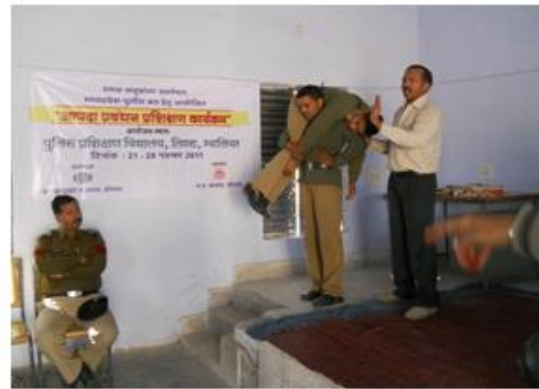
फायरमेन लिफ्ट विधि 1