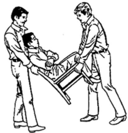
कुर्सी के सहारे जे लाना