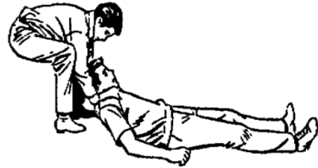
कंधे के सहारे खींचना