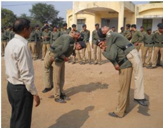
पीठ से उल्टा लेकर जाना