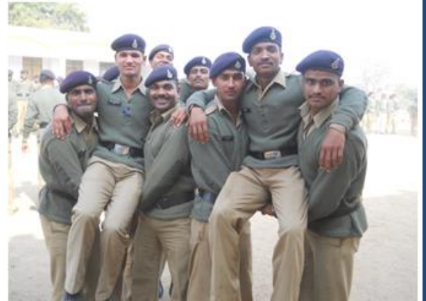
फोर हैण्ड शीट विधि