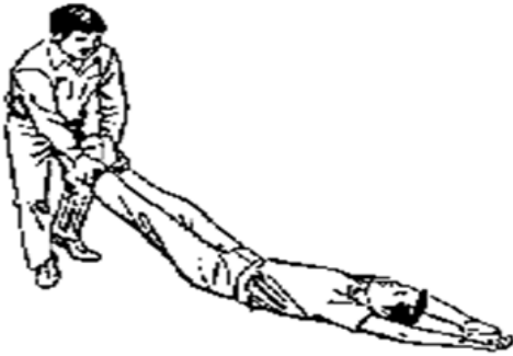
पैर के सहारे खींचना